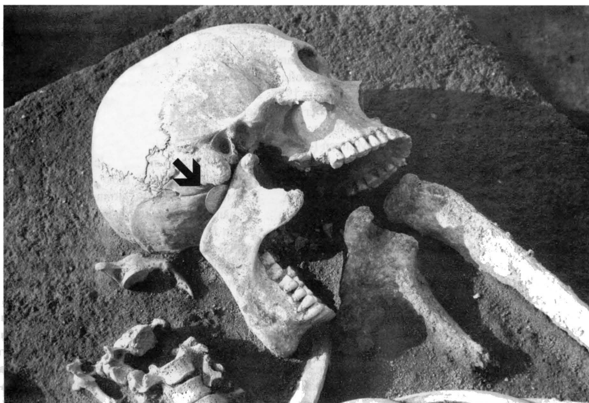
Abb. 3. Mikulĉice (Bez. Hodonín). Detail des Grabes 480 mit der Lage der Mŭnze Kat.Nr. 1.