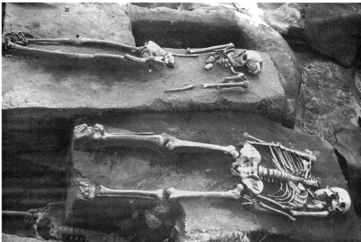
Abb. 2. Mikulĉice (Bez. Hodonín). Vorn Grab 480 mit dem Solidus Kat.Nr. 1.