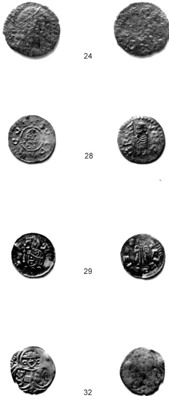
Abb. 7. Mikulčice (Bez. Hodonín). Mūnzen Kat.Nr. 24, 28-29 und 32.