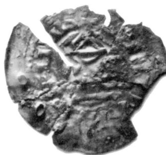
Abb. 6. MĀkulĀice (Bez. HodonĀn). MĀnzen Kat.Nr. 16, 19, 20 und 21.