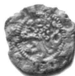
Abb. 4. Mikulčice (Bez. Hodonín). Můnzen Kat.Nr. 1, 2, 4, 6 und 7.