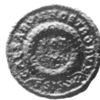
Abb. 5. Mikulčice (Bez. Hodonín). Můnzen Kat.Nr. 8-11, 13 und 14.