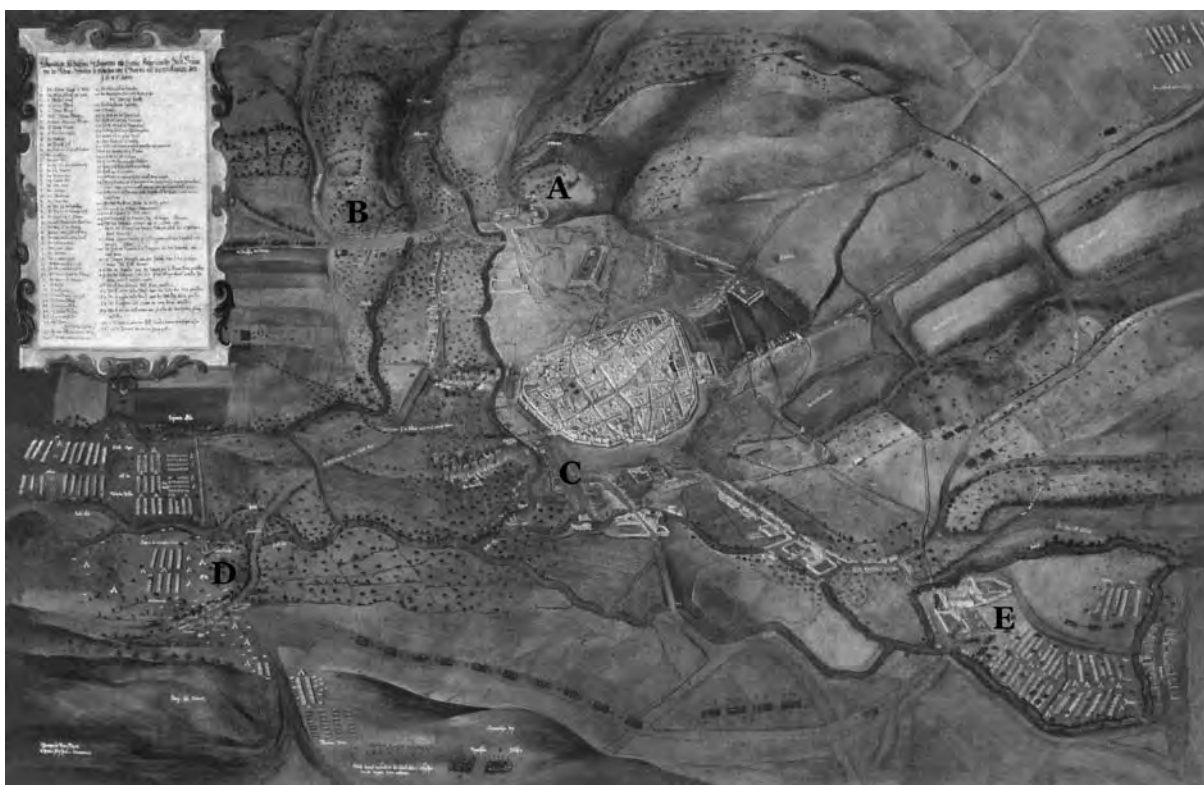
Abb. 2. Vedute von H. B. Beyer und H. J. Zeiser aus der Mitte des 17. Jahrhunderts mit der Darstellung der schwedischen Belagerung Brünns am 3. Mai 1645 (Museum der Stadt Brünn, Inventarnummer 2284). Die Vedute zeigt das historische Fluss- und Kommunikationsnetz von Südosten: A – Staré Brno (Altbrunn), das linke Schwarza-Ufer, B – Staré Brno, das rechte Schwarza-Ufer, C – Dornych, D – Benediktinerkloster in Komárov, E – Prämonstratenserkloster in Zábřovice.

beiden Gruben in Überschneidung mit einer älteren, ebenfalls jungburgwallzeitlichen Grube befand. Außerdem weisen knöcherne Gegenstände und eine „Bürste“ (ZAPLETALOVÁ im Druck), die an dem an der Ecke der Straßen Vojtova und Grmelova gelegenen Fundort entdeckt wurden, noch darauf hin, dass dort Textilien hergestellt wurden. Leider lässt sich im Nachhinein nicht mehr feststellen, ob diese Funde der älteren oder der jüngeren Siedlungsphase zuzuordnen sind.